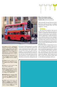
1/4 page FU 118 L x 86 H