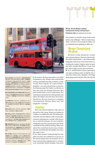
1/6 page FU 55 L x 123 H