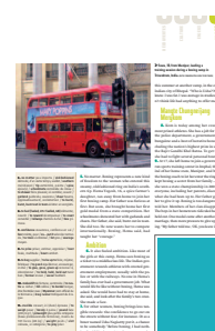
1/9 page FU 55 L x 80 H