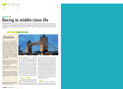
Pleine page 210 L x 287 H