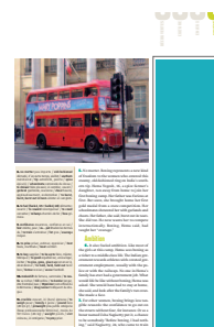
1/3 page hauteur FU 55 L x 230 H