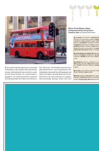
1/2 page largeur FU 176 L x 123 H